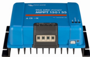
Solar Lade-Regler MPPT 150/35